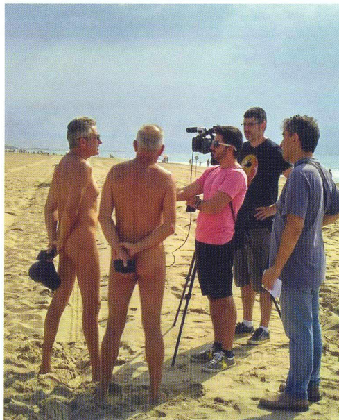
Un soci de l'ANPA i el president reivindiquen, davant els mitjans de comunicació, el reconeixement d'una platja nudista al Baix Penedès.

Disposa de serveis de dutxa i passarel·la i comparteix el servei de vigilància, socorrisme i pàrquing amb la platja de Sant Gervasi.